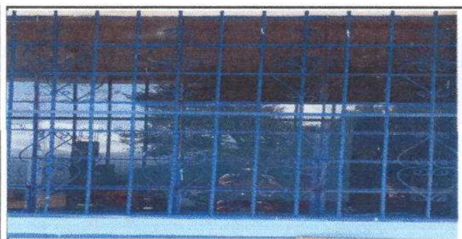
Foto 5: 19.2 Instalación de 17 m2 de balcon de metal en ventana de aula y dirección.