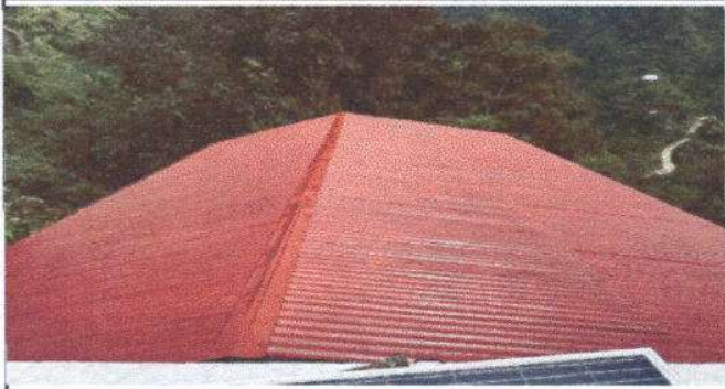
Foto1: 2.1 Mantenimiento a estructura de soporte de metal 132 m2.